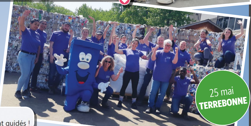
25 mai TERREBONNE