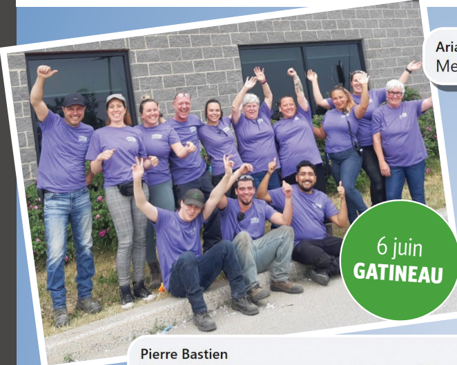
6 juin GATINEAU