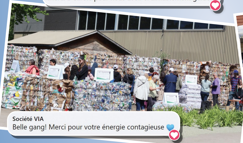
Société VIA Belle gang! Merci pour votre énergie contagieuse 🌟